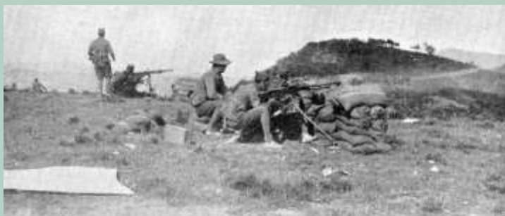
10 de mayo de 1924. La posición de Sidi-Mesaud ha sido sitiada por las cábilas rebeldes; la II, III y IV Banderas acuden en su auxilio. Trás durísimos combates el enemigo es puesto en fuga. Las bajas